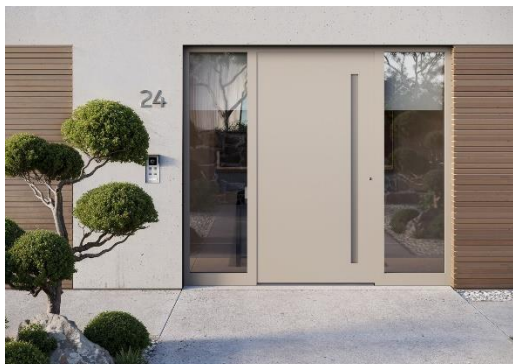
[heroal D 72 PF EM Haustür]

I profili anta porta heroal D 72 PF EM riducono le fasi di realizzazione e consentono di risparmiare materiale nella produzione di porte. Il portafoglio di sistemi è ora ampliato dalla variante con pannello a sormonto bilaterale heroal D 72 PF EM bs