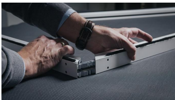
[heroal Ready VS Z EM_Montage_Schritt 2]

Papierloos en tijdbesparend: in de heroal Business Configurator kunnen heroal vakspecialisten digitaal offertes opstellen en bestellingen plaatsen.