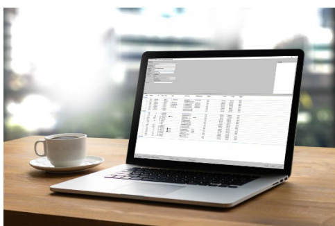
[Online Bestellwesen LogiKa]

heroyal ondersteunt zijn partners niet alleen met een toonaangevend aanbod van systeemoplossingen, maar ook met uitgebreide services en digitale tools die efficiëntie, flexibiliteit en toegevoegde waarde garanderen in alle fasen van een bouwproject.