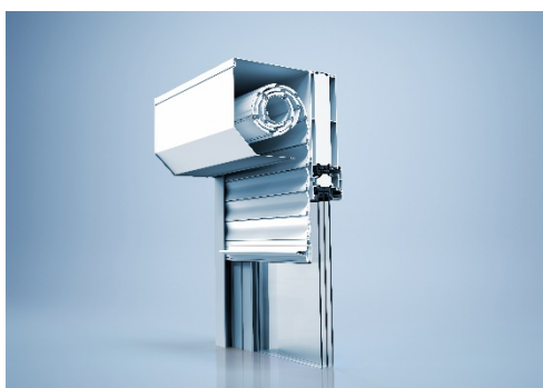
[heroal Ready RS 52 Vorbaurollladen]

Pour les éléments finis heroal Ready préconfectionnés dans le domaine des volets roulants à auvent, d'autres variantes de lames sont disponibles dès maintenant : les lames de volets roulants heroal RS 38 et heroal RS 42 ainsi que les lames de volets roulants de sécurité heroal RS 55 SL (voir image).