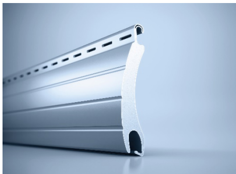
[heroal RS 55 SL Rollladenstab]

Pour les éléments finis heroal Ready préconfectionnés dans le domaine des volets roulants à auvent, d'autres variantes de lames sont disponibles dès maintenant : les lames de volets roulants heroal RS 38 et heroal RS 42 ainsi que les lames de volets roulants de sécurité heroal RS 55 SL (voir image).