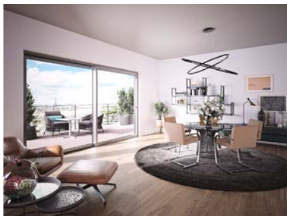
[heroal S 65 Wohnungsbau]

heroal S 65 is een aluminium schuifdeursysteem voor royale doorgangsoeningen binnen de hoogwaardige woning- en projectbouw dat zich onderscheidt door zijn geoptimaliseerde productie.