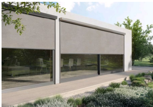
[heroal VS Z 25 mm Fuehrungsschiene]

Une largeur visible minimale pour un design moderne : avec une largeur visible de seulement 25 millimètres, les coulisses de l'écran textile heroal VS Z sont les coulisses les plus fines du marché.