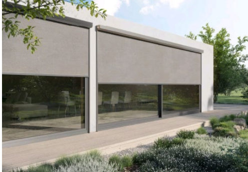
[heroal VS Z 25 mm Führungsschiene]

Minimale Ansichtsbreite für modernes Design: die neue Führungsschiene des Textilscreens heroal VS Z ist mit nur 25 Millimetern Ansichtsbreite die schmalste Führungsschiene am Markt.