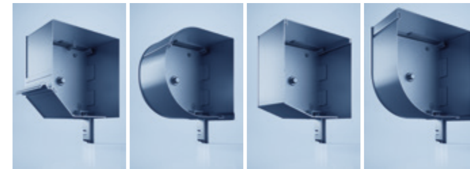
heroyal FMR 45° heroyal FMR HC heroyal FMR 20° heroyal FMR Q

Passgenaue Lösungen für kleine oder große Deckbreiten, erhöhten Sicherheitsbedarf oder geringen Platzbedarf – heroyal bietet Vielfalt: vom Rollladenstab mit nur 32 mm Deckbreite über einen Rollladenstab für sehr große Öffnungen bis hin zu hochstabilen Stäben aus Edelstahl-Legierung.