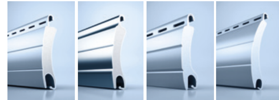
heroyal RS 53 RC 2 heroyal RS 37 RC 3 heroyal RS 32 heroyal RS 54

Passgenaue Lösungen für kleine oder große Deckbreiten, erhöhten Sicherheitsbedarf oder geringen Platzbedarf – heroyal bietet Vielfalt: vom Rollladenstab mit nur 32 mm Deckbreite über einen Rollladenstab für sehr große Öffnungen bis hin zu hochstabilen Stäben aus Edelstahl-Legierung.